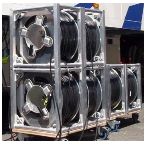
Orbiter PV série